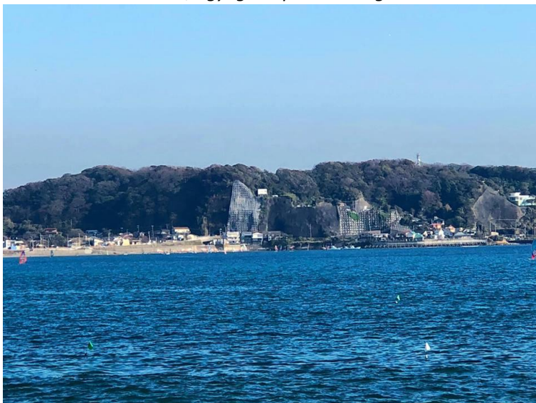
A sziget átmérője nagyjából kettő kilométer, amit egy 600 méter hosszú hídon lehet megközelíteni.